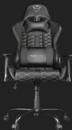
PRODUCT FRONT 1