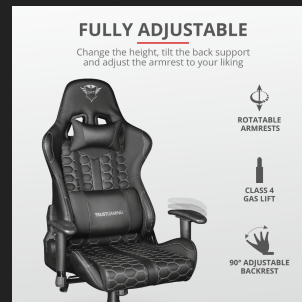
PRODUCT PICTORIAL 2