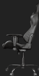
PRODUCT SIDE 1