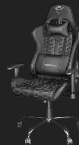
PRODUCT VISUAL 2